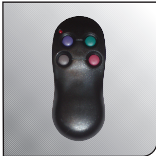
Notfallmelder – Und die Polizei weiß Bescheid!