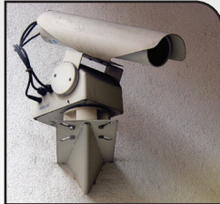
Videoüberwachung – Alles im Blick!