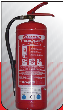
Feuerlöscher – Für sofortiges Eingreifen!