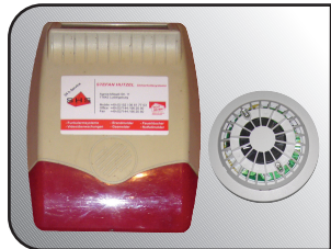
Brand- und Gasmelder – Garantiert feuerfest!